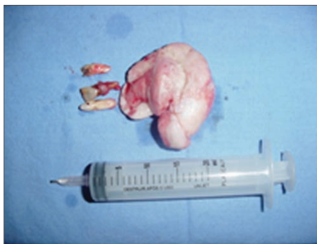
Figura 7. Tumor removido com fatores irritantes (peças dentárias).

Devido suas similaridades clínicas e histopatológicas, pensa-se que alguns fibromas ossificantes periféricos desenvolvem-se inicialmente, como um granuloma piogênico, que sofre maturação fibrosa e subsequente ossificação. Frequentemente essas lesões são confundidas e removidas por incisão superficial. Para minimizar a tendência à recidiva, é importante que se remova completamente a lesão,