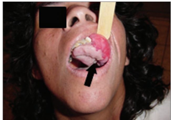
Figura 1. Exposição do tumor.

O tratamento de escolha é a excisão cirúrgica total, inclusão do perióstio (3) e do ligamento periodontal envolvido (9), bem como a remoção do agente agressor identificável. Essa abordagem é citada na literatura como atenuante do grau de recidiva que é considerado alto (2, 3,