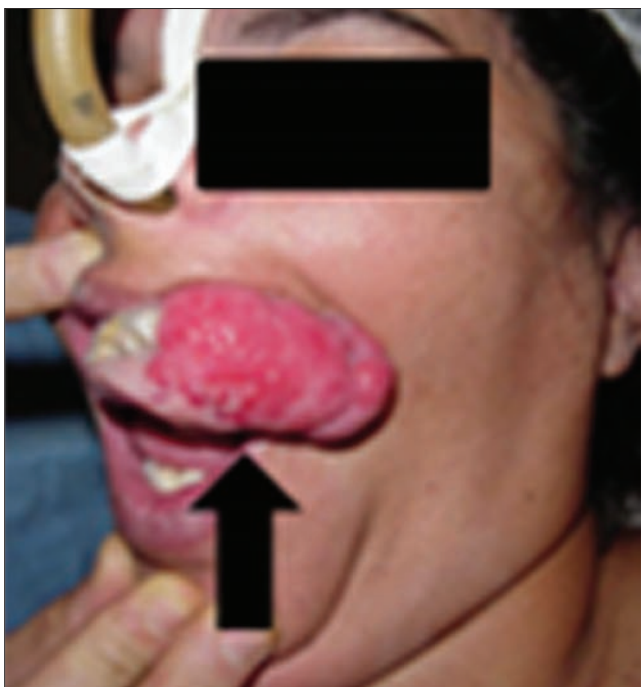
Figura 3. Extensão posterior do tumor.