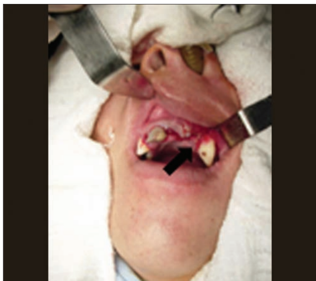
Figura 5. Mucosa suturada.