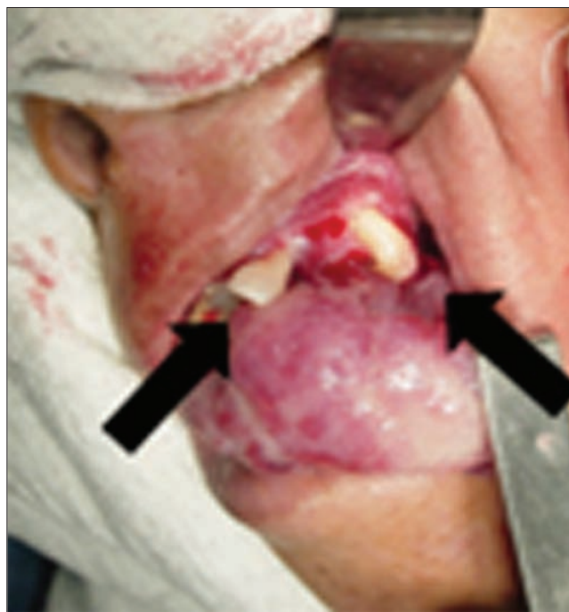
Figura 4. Deslocamento de peças dentárias.

Na anamnese foram colhidos dados sobre doenças sistêmicas pré-existentes, tabagismos e etilismo, havendo resposta negativa a todas elas.