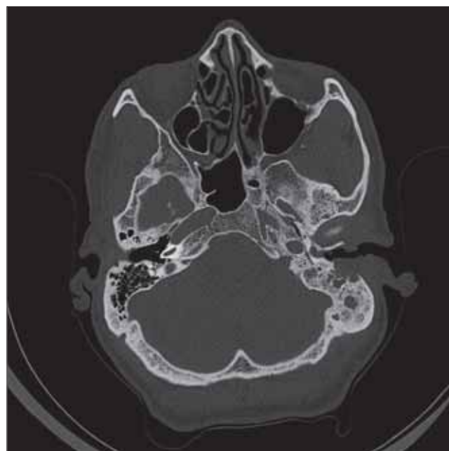
Figura 2. TC em corte axial, evidenciando acometimento de conduto auditivo externo.

Após o tratamento cirúrgico paciente relatou melhora parcial da paralisia facial, mas culminou com perda auditiva pois foi necessário uma conduta agressiva para retirada de toda massa.